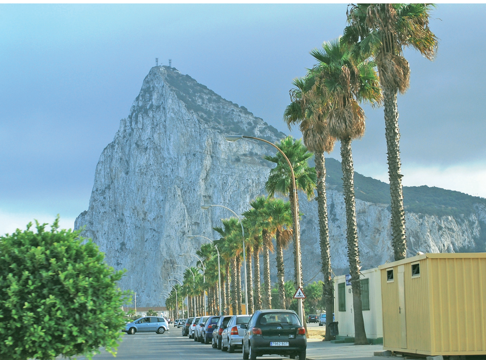
Gibraltar je tradičním symbolem Impéria v západním Středomoří. Netradiční pohled na skálu ze severozápadu, od španělské hranice.

Přestože Britské impérium zaniklo, v řadě zemí přetrvávají některé kulturní aspekty