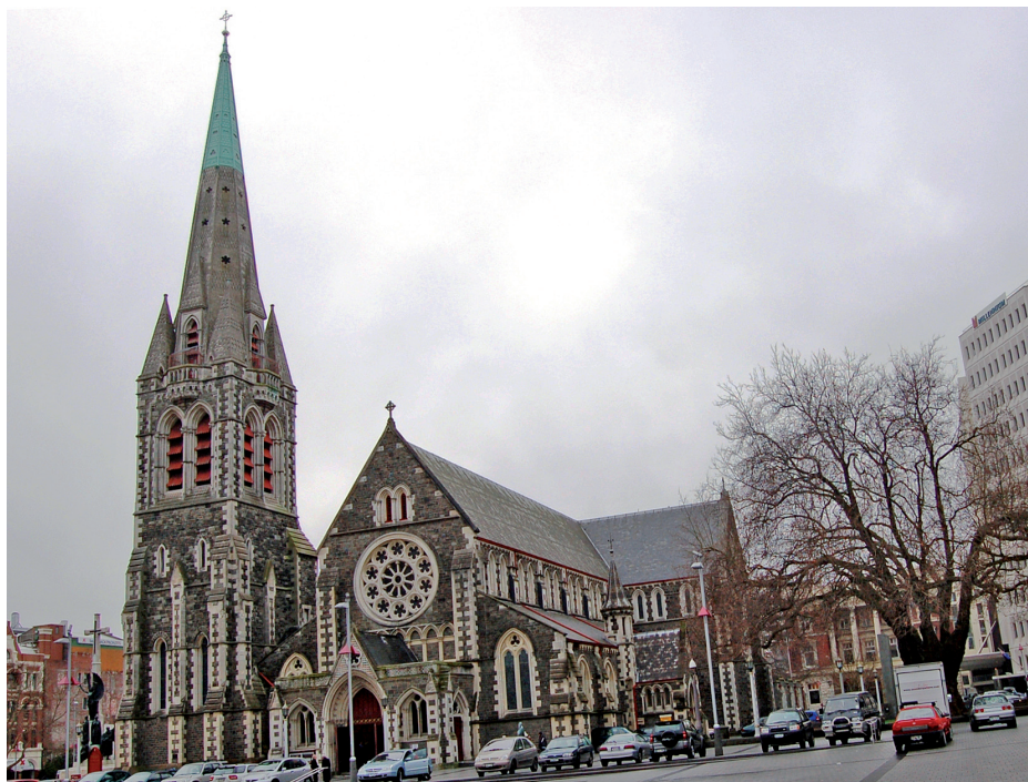
Christchurch – nejangličtější město na světě – leží na Novém Zélandu. Na obrázku katedrála, jejíž věž se zřítla při velkém zemětřesení v únoru loňského roku.

Vazbu na impérium má i prestižní ocenění nejvýznamnějších osobností v oblasti vědy, veřejných služeb a charitativních programů – řád Britského impéria (s mottem For God and the Empire ). Poprvé jej udělil král Jiří V. v r. 1917 za bojovou činnost v první světové válce. V r. 1965 byli tímto řádem vy-