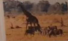
snída a rince