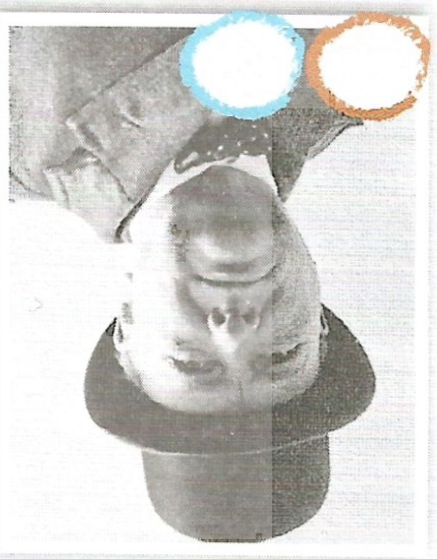
(R) Josif V. Stalin