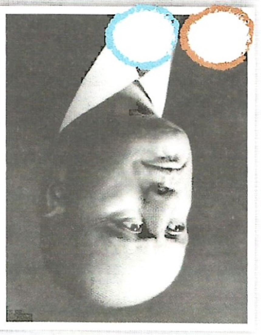
(N) Hans Frank