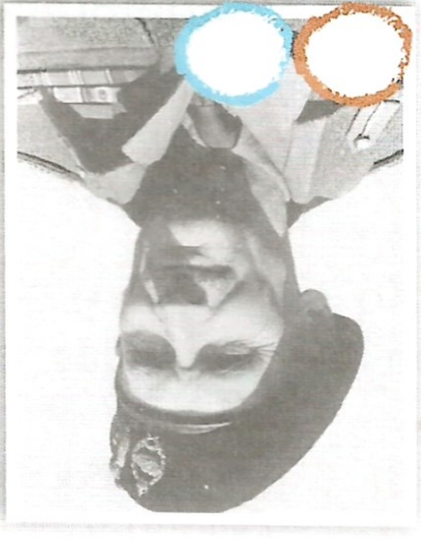
(S) Benito Mussolini