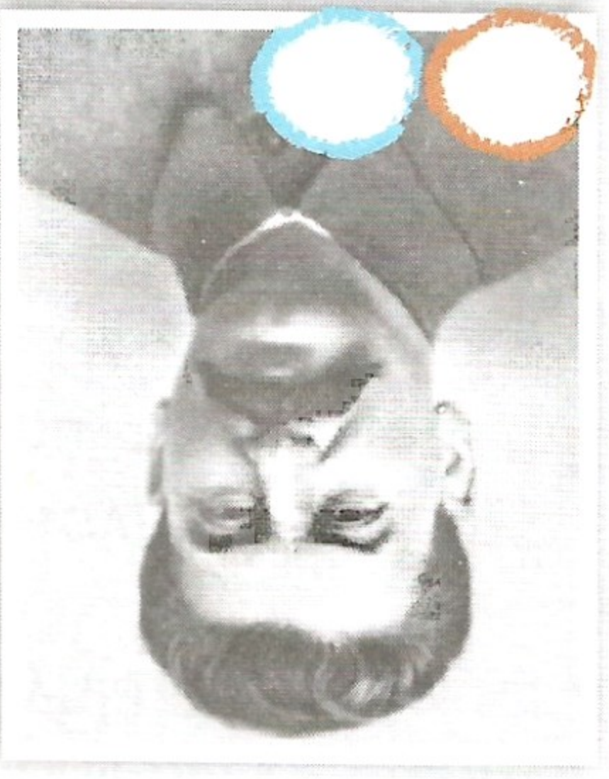
(W) Winston Churchill