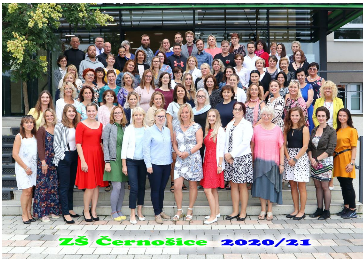
Přehled tříd a pedagogických pracovníků: