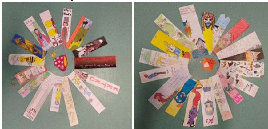
záložky ze Slovenska