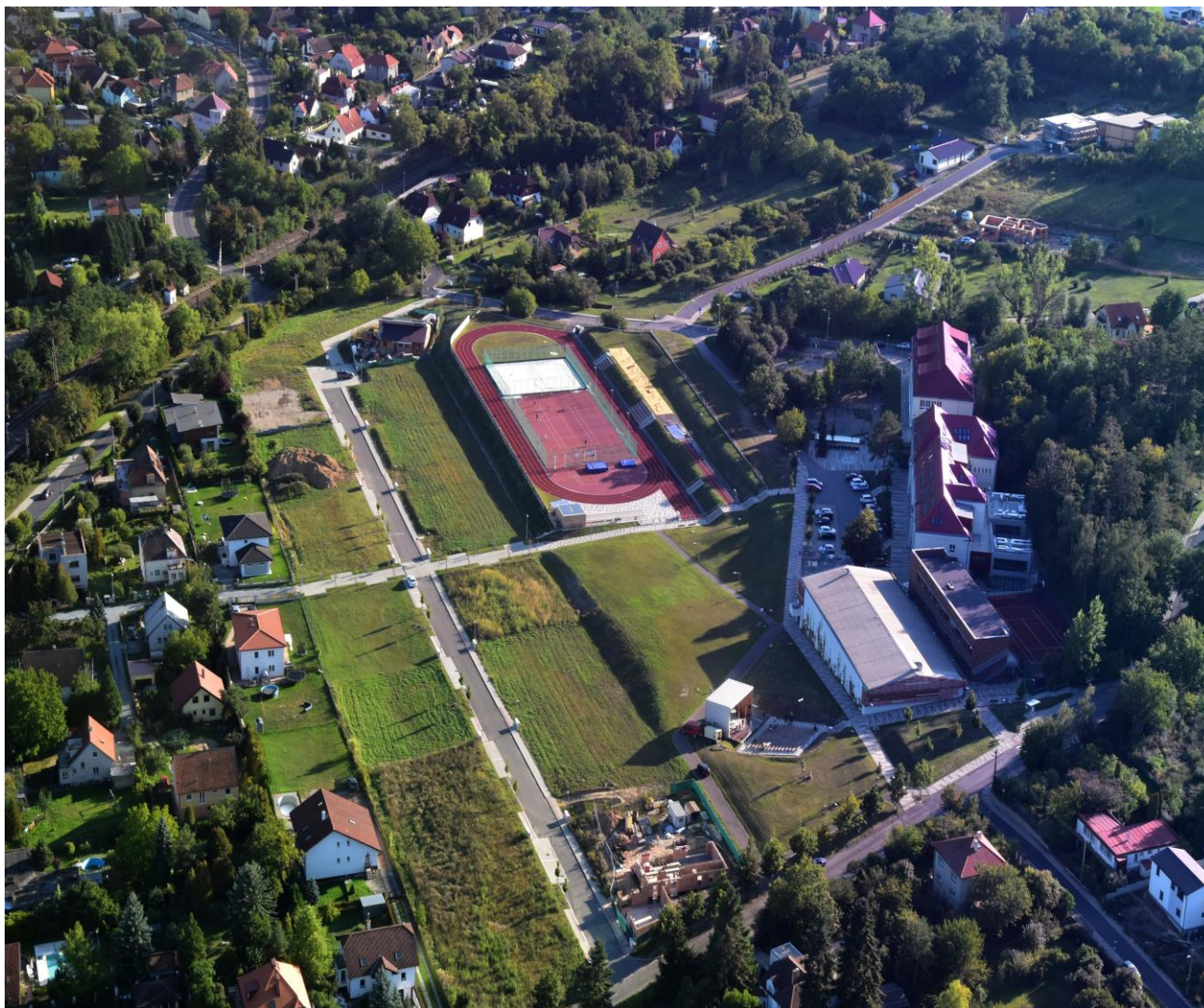
Areál základní školy v Černošicích